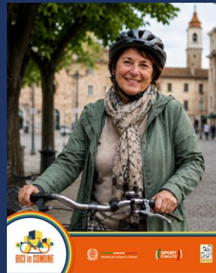
Format 2 – “ Che strada fai? ”

Pensato per raccontare, attraverso immagini e brevi storie autentiche dal territorio, i piccoli interventi e le azioni concrete realizzate dai Comuni grazie al progetto “Bici in Comune”.