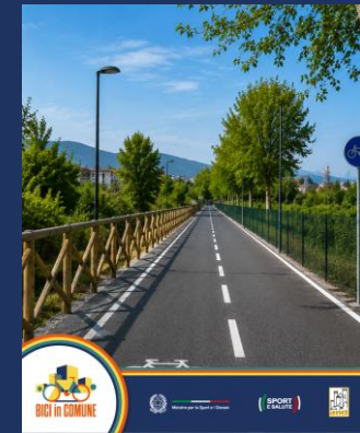
Format 3 – “ Risultato sul territorio ”

Racconta, attraverso volti, percorsi e testimonianze dei cittadini, come la bicicletta faccia parte della quotidianità e della vita dei territori coinvolti nel progetto “Bici in Comune”.