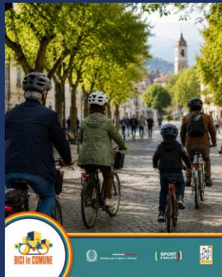
Format 1 – “ Strade di casa ”

Di seguito vengono presentate tre proposte di format per la creazione di contenuti social dedicati al progetto “Bici in Comune” per i mesi di giugno, luglio e agosto 2026 . I Comuni potranno scegliere di volta in volta un format per poi adattare e personalizzare queste idee con storie, immagini e contenuti originali legati alle attività, agli eventi e agli interventi realizzati sul proprio territorio.