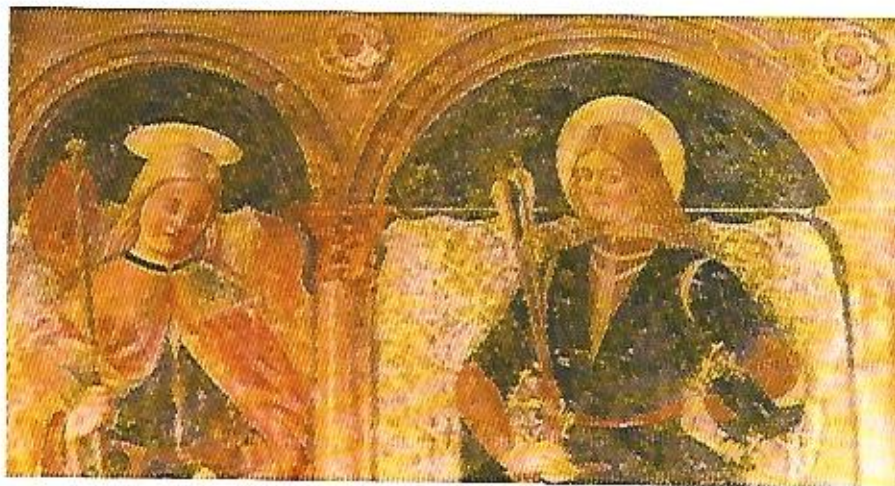
Affreschi d'alta epoca nella chiesa parrocchiale di Ozzano

Da studiare anche gli altorilievi dell'altare. Tutto il centro del paese conserva l'impronta medievale, di rilievo casa Bonaria.