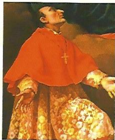
San Carlo Borromeo, particolare della tela della Madonna con Bambino, conservata nella parrocchiale

Ed aggiungeva a proposito delle pertinenze: "Delle antiche mura di cinta resta tuttavia qualche bel tratto; restano pur anco alcune basse case a sporgentissimo ballatoio, la torre che è addossata alla roccia e qualche merlo del feudale castello. La torre stessa, benché staccata alquanto dalla vecchia chiesa parrocchiale, venne convertita in un campanile".