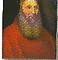
Retrato di Mercurino Arborio di Gattinara